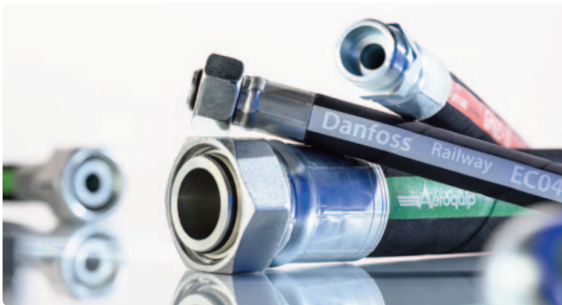
VIGOT® Schlauchtechnik bedeutet Präzision, Erfahrung und Qualität.

Mit dem neuen Zentrum für Schlauch- und Armaturentechnik stellt SCHAUBURG Industrietechnik die Weichen für die Zukunft. Die Planung ist abgeschlossen, und der Baubeginn steht bevor, im Herbst erfolgt der Umzug. Damit wächst der Standort in Bremen, und mit ihm die Erfolgsgeschichte der etablierten SCHAUBURG-Marke VIGOT®. Seit 1864 steht sie für Kompetenz, Qualität und Innovationskraft. Künftig wird hier die gesamte Wertschöpfungskette der Schlauch- und Armaturentechnik abgebildet: von der Entwicklung über die Fertigung bis hin zur Schlauchprüfung und Dokumentation – effizient, digital und aus einer Hand.